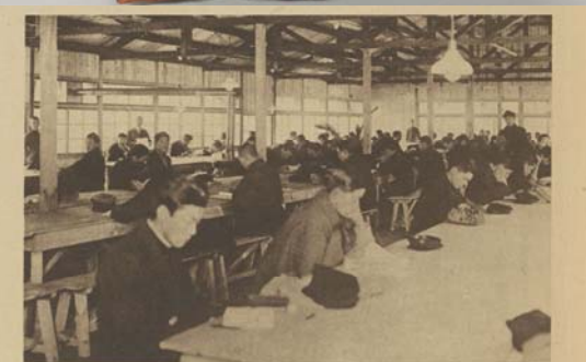
仮図書館閲覧室（大正十三年より昭和三年まで使用）