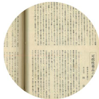
当時の雑誌から見る震災