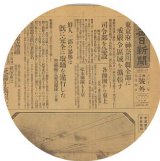
新聞や文学作品等に描かれた関東大震災