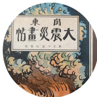
関連図書から見る震災