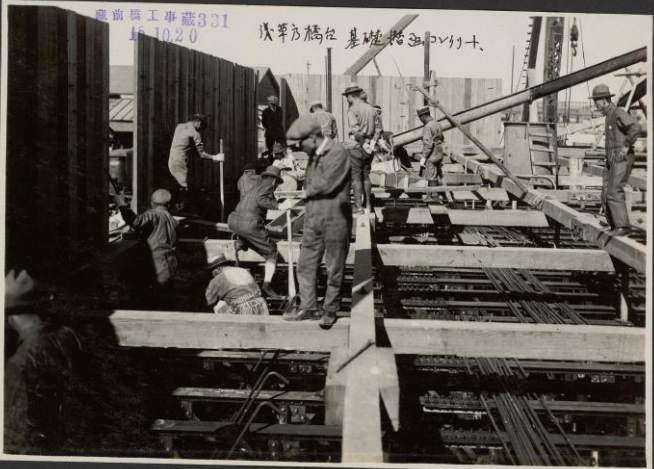
阪前橋工事誌331 15.10.20 淡草方橋台基礎塔コンクリート