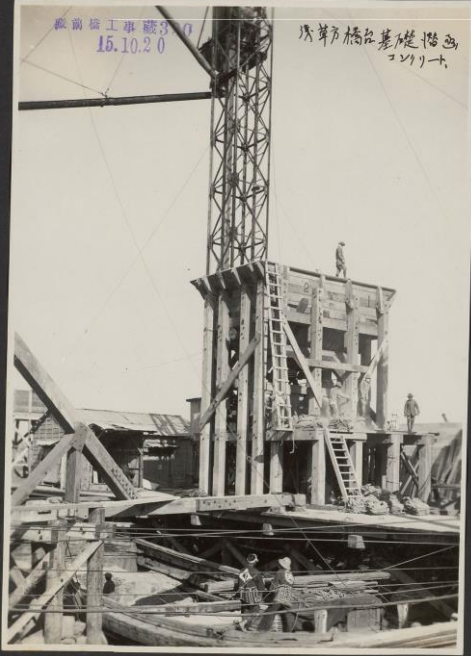
阪前橋工事誌330 15.10.20 淡草方橋台基礎塔コンクリート