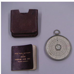
円形計算機 Halden Calculex

W. & L. E. Gurley製。同社は1854年に創設されたニューヨークの有名な測量器械メーカー。