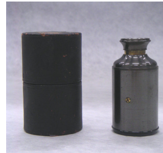
単眼鏡形ハンドレベル Monocular Hand Level

W. & L. E. Gurley製。同社は1854年に創設されたニューヨークの有名な測量器械メーカー。