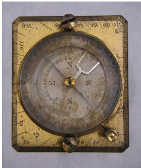
矩形分度儀 Rectangular Protractor

横浜のBruhl Bros & Co.が輸入販売したストップウォッチの機能の付いた時計。同商会の日本での営業は明治36年(1903)まで。裏蓋に葡萄の刻印がある。