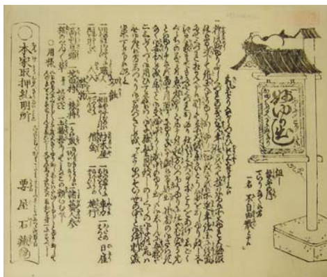
『一ふくにてこりこり薬妙ゆり出し』