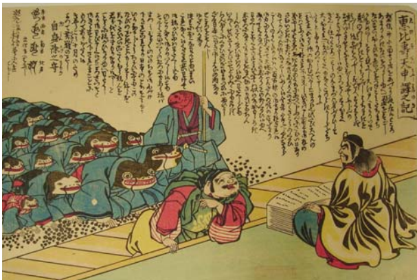
『恵比寿天申訳之記』